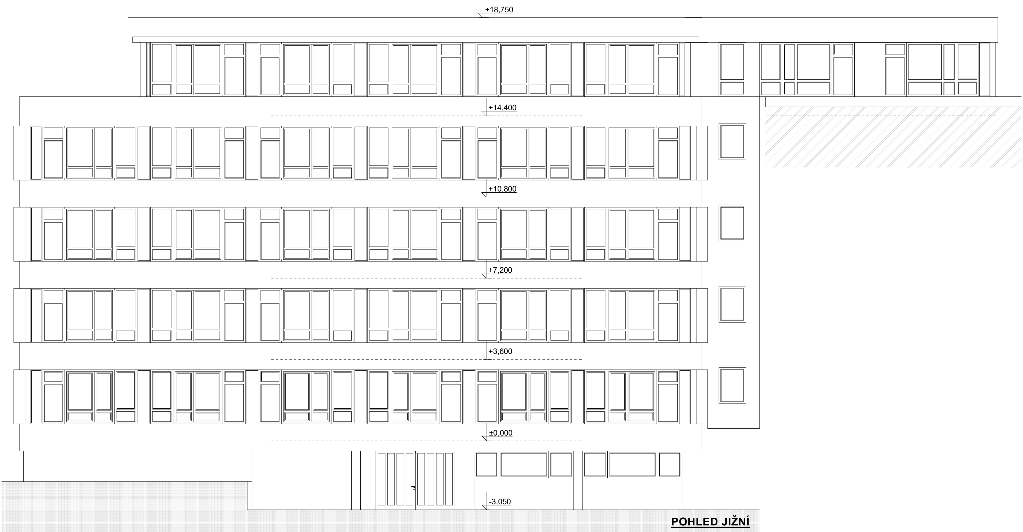
POHLED JIŽNÍ STÁVAJÍCÍ STAV