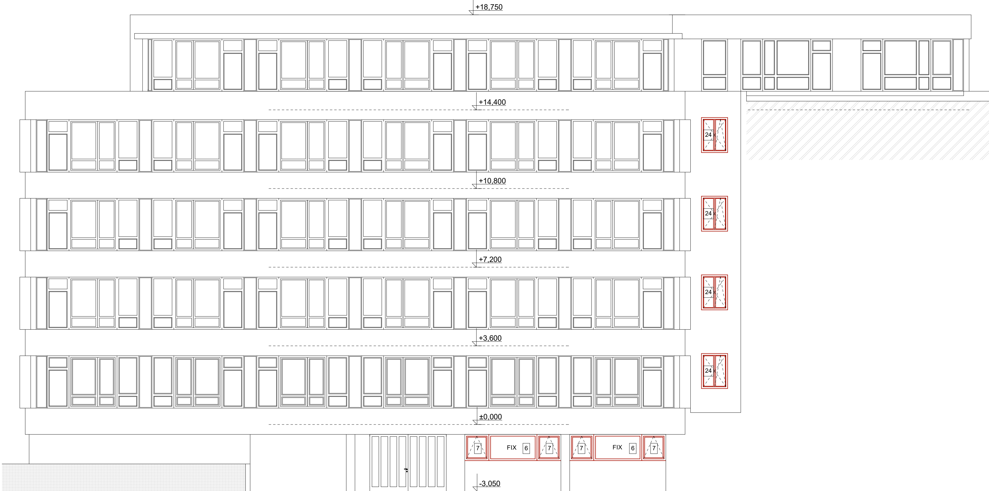
POHLED JIŽNÍ NOVÝ STAV